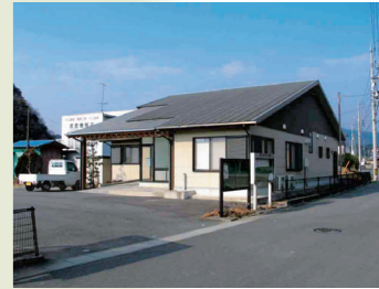
地域コア施設の例