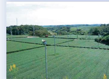
中の山/ビューポイント