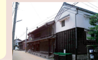
サテライト施設の例