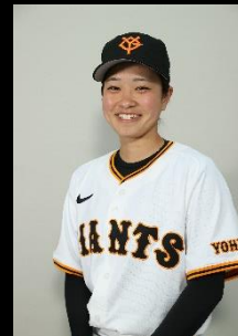
日高結衣選手

とき 令和6年12月22日(日) (第一部) 午前 9時～10時30分 (第二部) 午前11時～12時30分 ところ 西野公園体育館 参加料 無料 持ち物など 室内用シューズ、飲み物、動きやすい服装