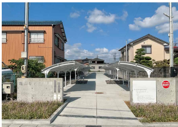
亀山駅西駐輪場(工事中:9月16日時点)

亀山駅や駅周辺を利用する皆さんの利便性向上のため、亀山駅西側に市管理の駐輪場(自転車と原動機付自転車[総排気量50cc以下])を開設します。駐輪場には、屋根、照明、防犯カメラ、自転車ラックを設置します。