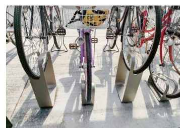
自転車用ラックへの駐車