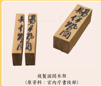
複製関木契