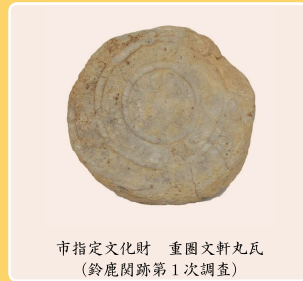
市指定文化財 重文文軒丸瓦 (鈴鹿関跡第1次調査)