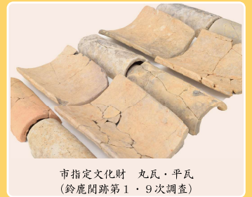
市指定文化財 丸瓦・平瓦 (鈴鹿関跡第1・9次調査)