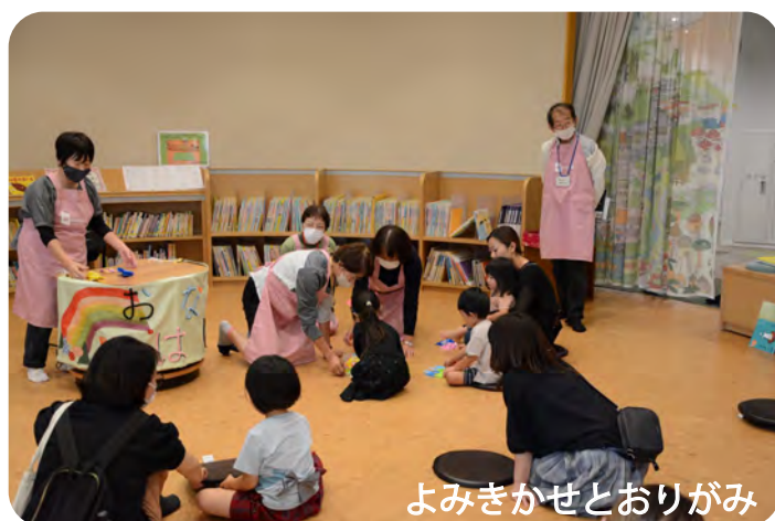
よみきかせとおりがみ