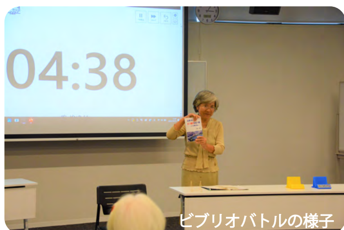
ビブリオバトルの様子