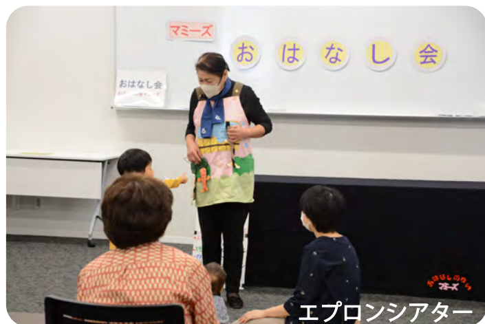
エプロンシアター

平成30年から始めた図書館まつり月間は、今年からは図書館交流イベントとなり、図書館ボランティアのみなさんと、多くのイベントを開催しました。