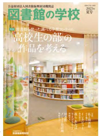
「図書館の学校」2023年夏号

亀山市立図書館は、市民参画や駅前のにぎわいの創出に取り組んでいることで注目を集めており、県内のみならず他府県からの視察や取材も増えています。図書館関係雑誌や建築雑誌、地域情報誌などさまざまな媒体で当館が紹介されています。