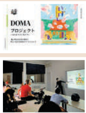
フランスで開催されたセミナーで亀山の魅力を発信(10月)