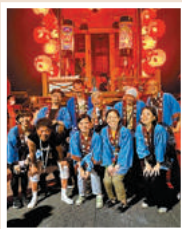
関宿祇園夏まつりへ参加(7月)