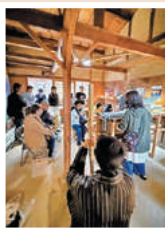
東海道関宿街道まつりにて駕籠乗車体験と竹の楽器作りワークショップ&即興演奏を実施(11月)