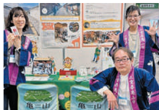
東京都で開催された移住フェア

亀山市加太出身。東京都町田市在住。故郷が過疎の危機にあることを受け、「何かできることはないか」と亀山市移住・交流促進アドバイザーに応募。三重と東京を行き来しながら、二拠点から見た独自の視点を生かし積極的に活動中。