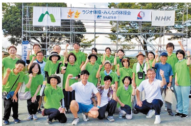
夏期巡回ラジオ体操・みんなの体操会(7月23日)

現NHKテレビ・ラジオ体操指導者。特定非営利活動法人全国ラジオ体操連盟理事長を務める。女子栄養大学実践運動方法学研究室非常勤講師を務めるほか、弘前大学大学院医学研究科博士過程に在籍し、長寿健康に関する研究に従事。「Science(科学)とPassion(情熱)」で「地域を元気に♪」をモットーに全国各地のラジオ体操講習会やイベントに参加している。