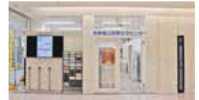
鈴鹿ハンターショッピングセンター内 (鈴鹿市算所2丁目5-1)にある 鈴鹿亀山消費生活センター

SNS型投資詐欺は被害額が高額になりやすく、いったん振り込んでしまうと、被害回復が非常に難しいのが特徴です。不安に思ったら、すぐにご相談ください。