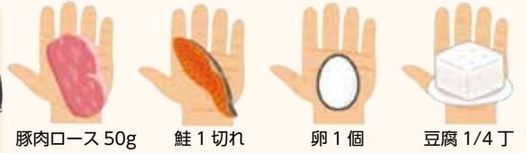
豚肉ロース 50g 鮭 1切れ 卵 1個 豆腐 1/4丁