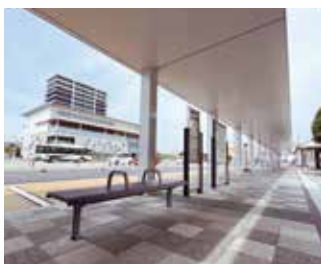
屋根が付き広々としたバス乗降場

※車椅子で乗車される場合、安全に乗車できるスペースが確保されたバス停であることが条件となります。