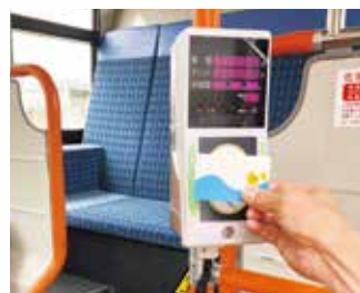
交通系ICカードも利用可能(一部車両除く)