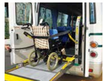
車椅子のまま乗降可能