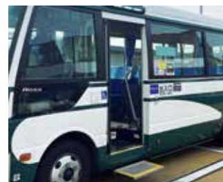
オートステップ機能付きの新型車両