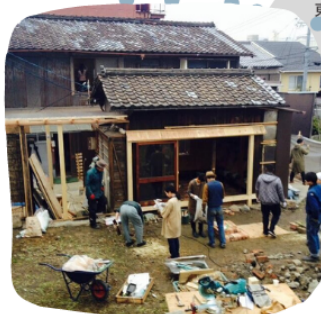
ステークホルダーとの協働による共有空間の創出 京都・本町エスコラ

1983年川崎生まれ。 2007年京都大学工学部建築学科卒業。 2014年京都大学大学院工学研究科建築学専攻博士課程終了。 立命館大学 R-GIRO 専門研究員(プレイスメイキング)、横浜国立大学 Y-GSA 産学連携研究員(建築、モビリティ)を経て、武蔵野美術大学、東京都市大学非常勤講師。 参加型デザイン、コミュニティによるデザイン、物活論(モノが生きているという考え方) 記号論、セカンドオーダーサイバネティクス、DIYなどの実践と研究を行う。 建築や場作りから、植物の栽培、狩猟、縫製、ダンスまでとモノ作りは多岐に渡る。 *著者『お金のために働く必要がなくなったら何をしますか?』