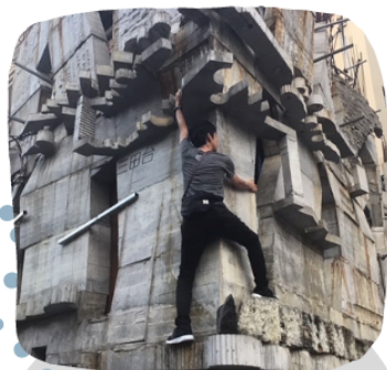
東京三田のセルフビルド建築・蟻鱗鳶