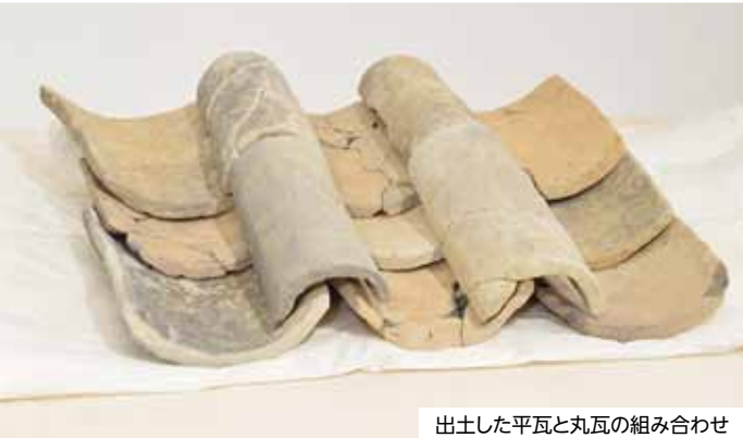
出土した平瓦と丸瓦の組み合わせ