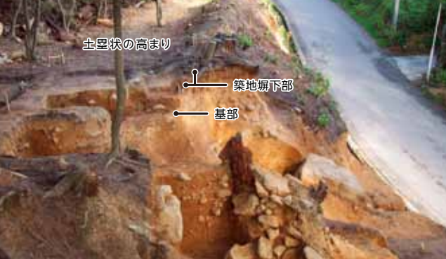
A 第1次発掘調査地 (西から)