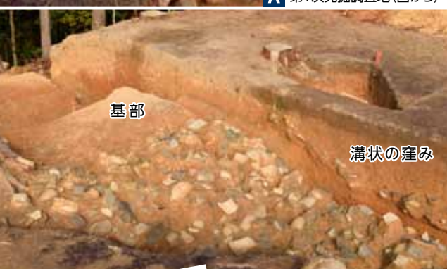
B 第9次発掘調査地 (南から)