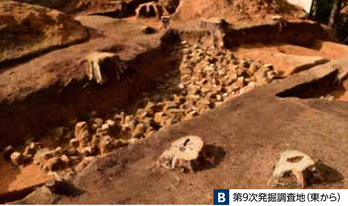
B 第9次発掘調査地(東から)