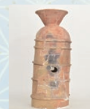
鱧付朝顔形円筒埴輪