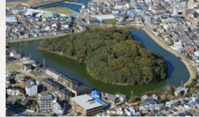
白鳥陵古墳（羽曳野市）