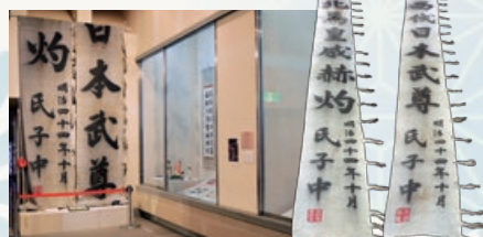
川崎町柴崎地区の秋祭りで掲げられた祭礼幟