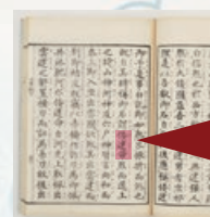
校正古事記 中巻 「倭建命」の文字が確認できる