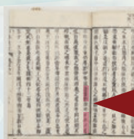
日本書紀 巻第七 「能褒野」と「日本武尊」の文字が確認できる

日本武尊の物語は、日本書紀とともに古事記にも記されていますが、さまざまな違いがあります。例えば、名前や地名に使われる漢字が異なります。名前は、日本書紀では「日本武尊」、古事記では「倭建命」、亡くなった場所は、日本書紀では「能褒野」、古事記では「能煩野」です。日本武尊のイメージも、日本書紀では父である景行天皇に信頼される力強い武人ですが、古事記では父に疎まれた悲劇の英雄として描かれています。