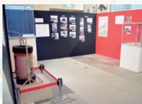
企画展 第2コーナーの様子