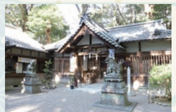
日本武尊に無償の愛をささげた妻弟橘媛の生誕地とされる忍山神社(野村四丁目)