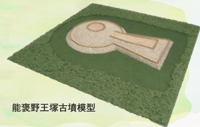
能褒野王塚古墳模型

平成25年、宮内庁書陵部が実施した調査によると、大きさは全長90m、後円部径54m、前方部長40m、前方部幅40m、後円部高8.5m、前方部高5.5mであることが分かりました。 北勢地域最大の前方後円墳です。