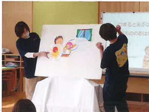
つぶっこちゃんパネルシアター