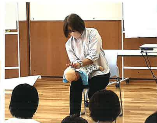
もしも詰まったら・・・対処法の実演 参加者全員が体験も出来ます！