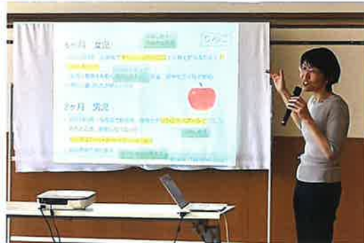
つまるとあぶない たべもののおはなし