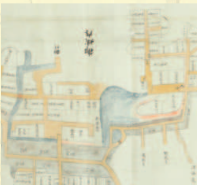
慶安四年亀山城下石川家中屋敷割絵図（部分）

「近世の武士たる所以」というテーマの下、第1部、第2部に流れるキーワードは、「武家の世代交代」です。つまり、織豊期の戦や関ヶ原合戦、大坂両陣を経験している世代から始まる江戸時代の武士が、世代交代を継続する中で、「近世の武士」になっていくことに着目しています。