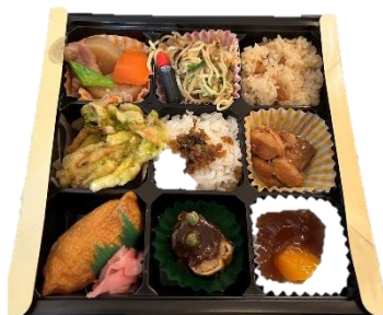
いこか弁当（イメージ）