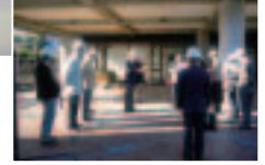
スポーツ研修センター