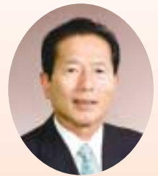
副議長 片岡 武男