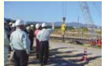
和賀白川線道路改良整備工事現場