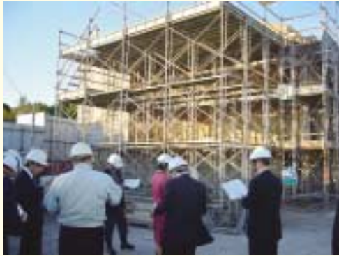
井田川・能褒野污水第1中継ポンプ場 建設工事現場