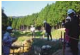
林道南河内線災害現場