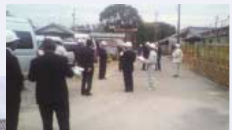
川崎地区コミュニティセンター 改築工事現場