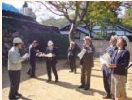
亀山城多門櫓復原工事現場