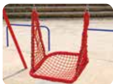
2人で一緒に乗れる 大型タイプ