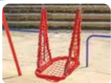
寝そべて使える ハンモックタイプ