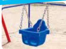
幼児の体を支える バケツタイプ