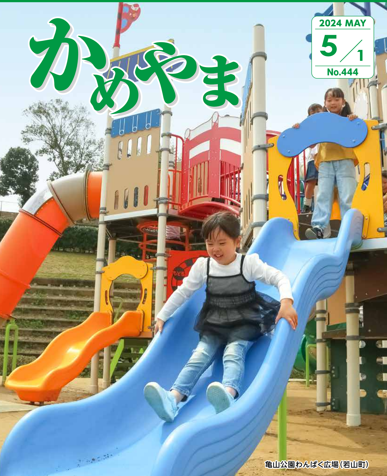
亀山公園わんぱく広場(若山町)