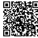
(国税庁ホームページ)