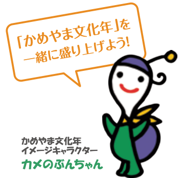
かめやま文化年 イメージキャラクター カメのぶんちゃん

その他 活動は無報酬で、交通費などの支給はありません。ボランティア保険に加入します。 ※応募用紙は、本庁(1階)、関支所、あいあい に備え付けてあるほか、市ホームページからもダウンロードできます。