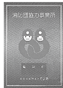
〈消防団協力事業所表示証〉