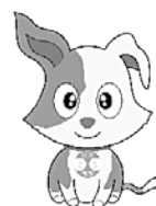
(行政相談のマスコット キクーン)