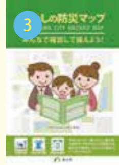
A4版防災冊子 (わたしの防災マップ)