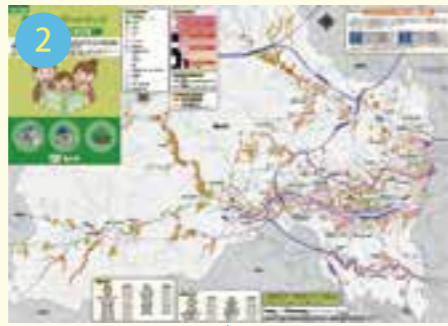
A1版風水害ハザードマップ