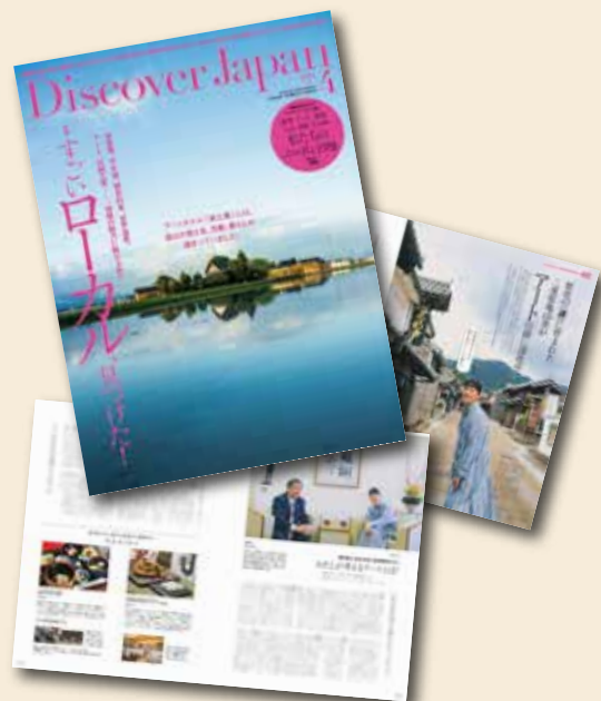
「ディスカバー・ジャパン」(2023年4月号)