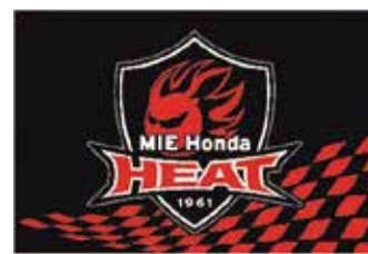
三重ホンダヒート

本田技研工業株式会社鈴鹿製作所のラグビーチームで、三重県をホストタウンとして、国内最高峰のラグビーリーグ「リーグワン」で活躍しているチームです。