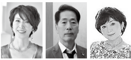
庄野真代 稲垣潤一 太田裕美

市文化会館(☎82-7111) 太田裕美、庄野真代がゲストに 稲垣潤一を迎え、昭和の名曲満載 のコンサートを開催します。 とき 1月21日(土)午後4時～ ※開場は午後3時30分～ ところ 市文化会館大ホール 入場料 全席指定[前売] 2,500 円、[当日] 3,000円 ※未就学児の同伴、ご入場はご遠 慮ください。 ※前売入場券が完売した場合、当 日券の販売はありません。