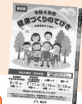
健康マイレージ事業のポイント対象です。

市内の実施歯科医院で受診(要予約) ※実施歯科医院など詳しくは、無料券をご覧ください。 ※実施歯科医院の診療時間内となりますので、事前にご確認ください。 ※紛失などにより、お手元に無料券がない場合は再発行できません。検診受診までに健康づくりグループへお問い合わせください。