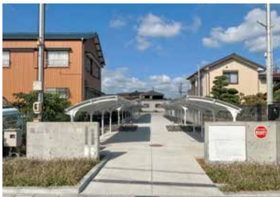
亀山駅西駐輪場(工事中:9月16日時点)

亀山駅や駅周辺を利用する皆さんの利便性向上のため、亀山駅西側に市管理の駐輪場(自転車と原動機付自転車[総排気量50cc以下])を開設します。駐輪場には、屋根、照明、防犯カメラ、自転車ラックを設置します。