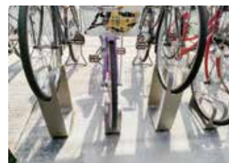
自転車用ラックへの駐車