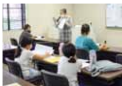
調べるって、 おもしろい！

7月31日からスタートした「ありがとう図書館」イベントには、たくさんの人にご来館いただきました。今回は、イベント前半の様子をご紹介します。(後半は10月1日号に掲載します)