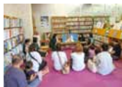
わくわくどきどき 絵本を遊ぶ