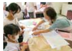
いろいろなかたちの 絵本をつくろう