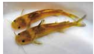
ネコギギ (絶滅危惧ⅠB類)