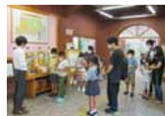
図書館ミニ見学会