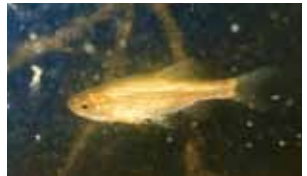
カワバタモロコ (絶滅危惧ⅠB類)