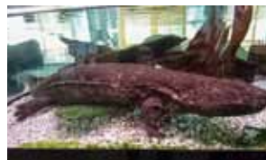
オオサンショウウオ (絶滅危惧Ⅱ類)

こうした生き物が生息し続けられるよう、本市の豊かな自然をみんなで守っていくことが必要です。