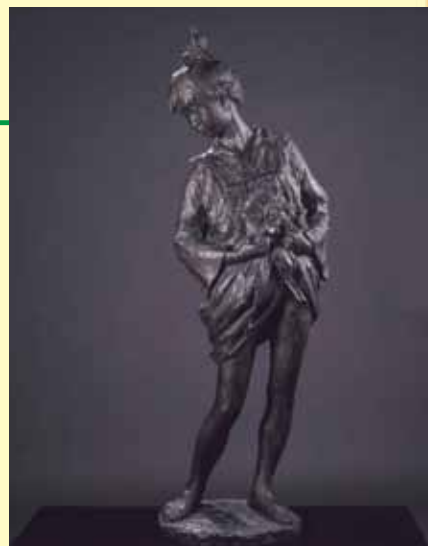
120cm(高さ)×36cm(幅)×45cm(奥行) 中村晋也美術館

井上靖の小説「海峡」の中の一文、「おしゃれな渡り鳥」から想を得たこの作品は、中村の少女像シリーズの中でも、特に人気のある代表作の一つと言えます。片足に重心をかけて、肩越しにうしろを覗き込むかのような少女の頭上に、どこからか飛来してきた小鳥が止まっているという情景描写は、映画のワンシーンのように比類のない美しさと爽やかな余韻を漂わせています。同じ年に制作された「水辺の囁き」とともに、スカートの裾を軽く持ち上げたポーズは、可憐な少女の姿を魅力的に伝えています。