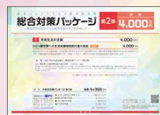
総合対策パッケージ 第2弾 総額 4,000万円