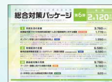
総合対策パッケージ 第6弾 総額 2,120万円