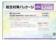
総合対策パッケージ 第8弾 総額 4億2,400万円