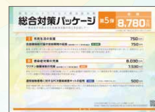
総合対策パッケージ 第5弾 総額 8,780万円