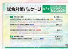
総合対策パッケージ 第3弾 総額 1億5,599.1万円