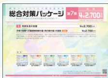
総合対策パッケージ 第7弾 総額 4億2,700万円