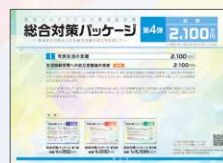
総合対策パッケージ 第4弾 総額 2,100万円