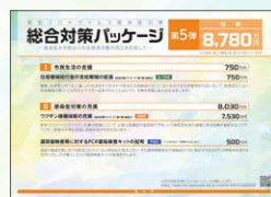
総合対策パッケージ 第5弾 総額 8,780万円