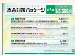
総合対策パッケージ 第3弾 総額 1億5,599.1万円