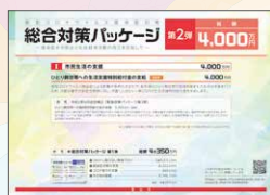
総合対策パッケージ 第2弾 総額 4,000万円