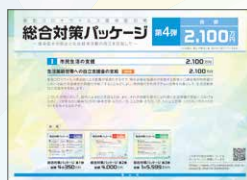
総合対策パッケージ 第4弾 総額 2,100万円