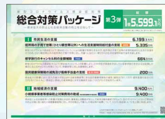
総合対策パッケージ 第3弾 総額 1億5,599.1万円