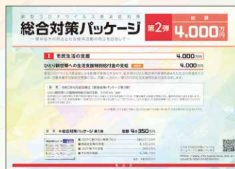
総合対策パッケージ 第2弾 総額 4,000万円