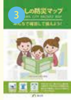
A4版防災冊子 (わたしの防災マップ)