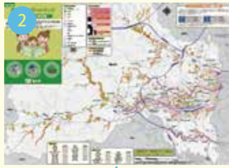
A1版風水害ハザードマップ