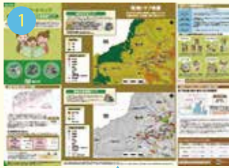
A1版地震ハザードマップ