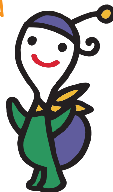
かめやま文化年イメージキャラクター カメのぶんちゃん