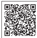
公式サイト (甲賀エリア)

滋賀・びわ湖ニューツーリズム「シガリズム」公式サイトでは、甲賀エリアの「シガリズム」を体験・体感できるスポットが動画などで紹介されています。日本遺産に認定された「忍者」、「信楽焼」などの歴史文化や豊かな自然をご体感いただき、心地よく、ゆったりとした気分を味わってください。