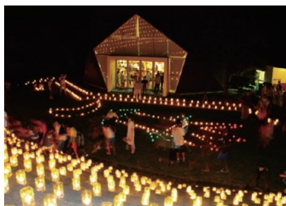
ペットボトルキャンドル