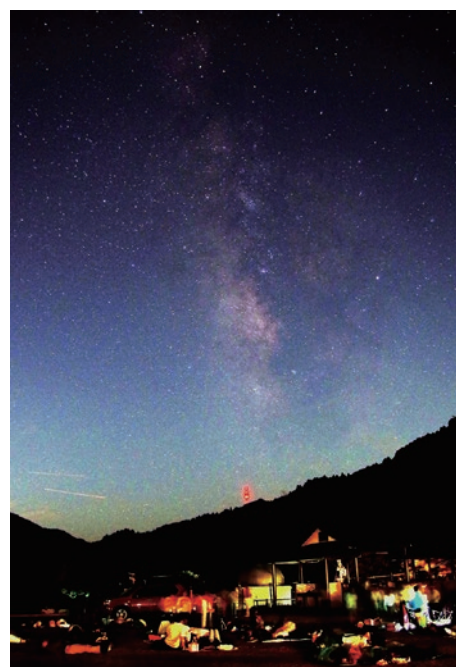
天の川と星空観察会

問合せ 教育委員会事務局生涯学習課社会教育グループ(☎84-5057) (当日のお問い合わせは、☎090-5114-1670(鈴鹿峠自然の家))