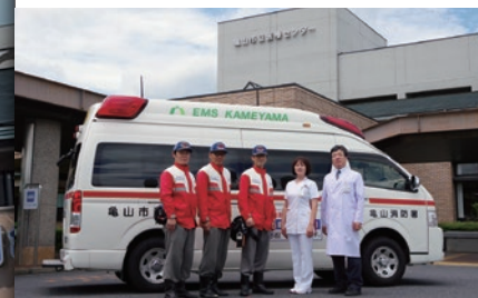
救急ワークステーションの運用開始