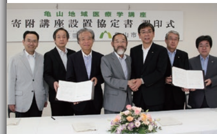
三重大学・亀山地域医療学講座の協定締結