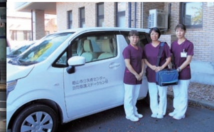
訪問介護ステーション「結」の開設