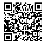
亀山市携帯サイト