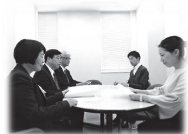
※調停で話し合う様子(イメージ)