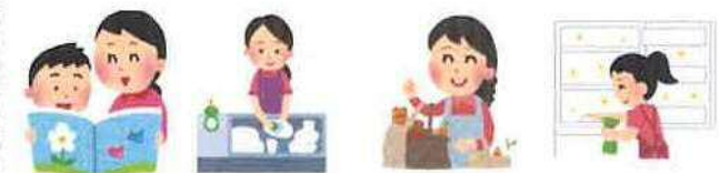
乳幼児の保育 食事の世話 生活必需品の買い物 住居の掃除

家庭生活支援員の派遣が依頼できる「対象家庭の登録」を受け付けています。詳しくは、健康福祉部_子ども未来課 (Tel: 96-8822)までご相談ください。