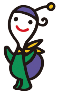
かめやま文化年 イメージキャラクター カメのぶんちゃん