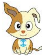
行政相談のマスコット キョーくん