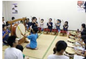
▲お囃子の練習風景

『夏祭りには昔から親と一緒に参加し、子ども山車も曳いたことがあります。大人になっても大好きなこの祭りに参加したいです』『夏祭りは江戸時代から続いていると授業で聞いたときはすごいと思ったし、みんなもっと来ればいいのと思いました』とみんな口々に笑顔で話してくれました。