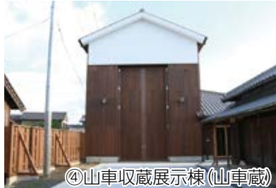
④山車収蔵展示棟(山車蔵)