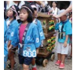
▲子ども山車 (関宿祇園夏まつり)