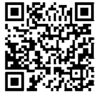
亀山市携帯サイト