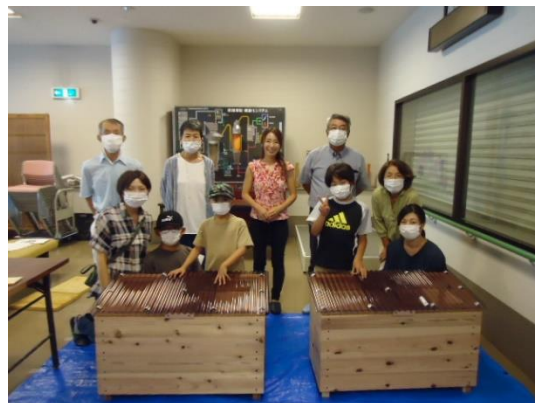
(キエーロ試作品作成時の様子(令和4年度))