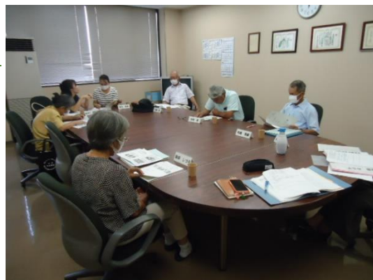
(第2回ごみダイエットサポーター会議の様子)

また、3月にごみ減量について、広報かめやまやマイタウンかめやまで啓発を行うことから、どのような内容にするかについても話をしました。