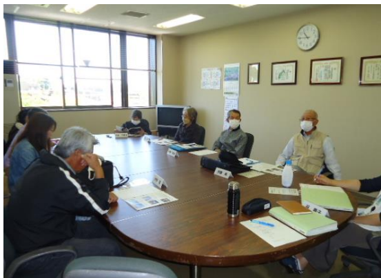
(第1回ごみダイエットサポーター会議の様子)

食品ロス削減マッチングサービス「タベスケ」や消滅型生ごみ処理容器「キエーロ」の普及方法、イベント時のごみ減量などについて話し合いました。特に、令和4年度に試作品等を作成したキエーロについて、今後普及させるためには、どうしていくのがよいか、熱心に話し合いが行われました。