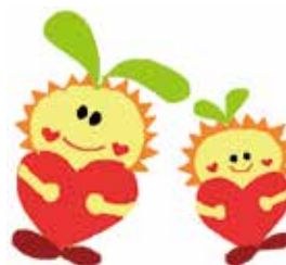
三重県里親啓発公認キャラクター「みえさとちゃん」