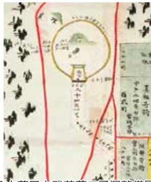
亀山藩日本武尊墓二子塚整備図