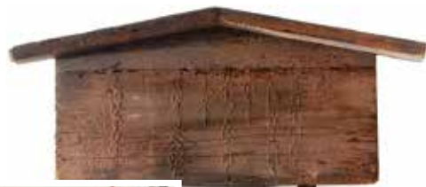
五榜の掲示 キリシタン禁止高札