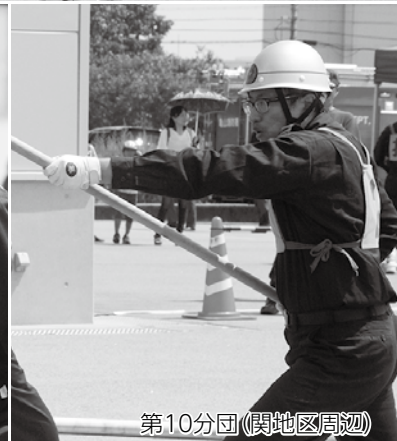
第10分団(関地区周辺)