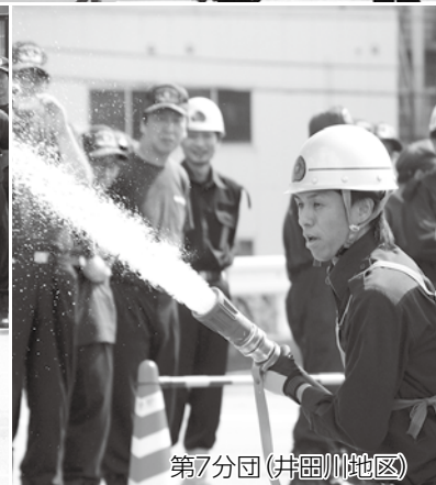
第7分団(井田川地区)