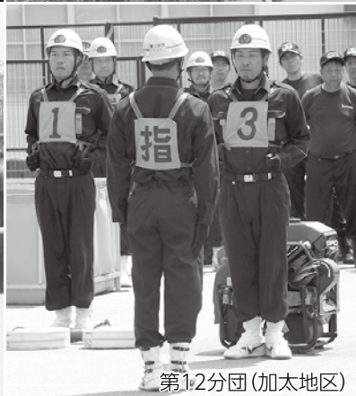
第1・2分団(加太地区)