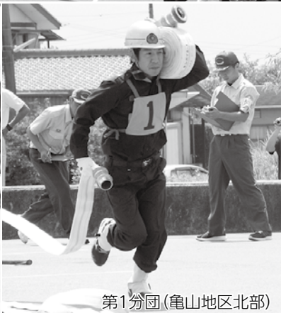
第1分団(亀山地区北部)