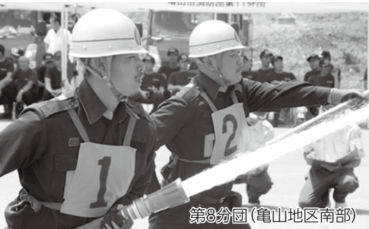
第3分団(亀山地区南部)