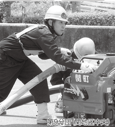
第9分団(関地区中央)