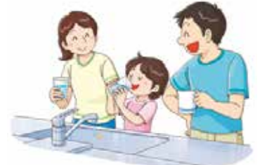
イラスト：政府広報オンライン

水道水以外にもさまざまな水を選択できる今だからこそ、あらためて水道水について、考えてみませんか？