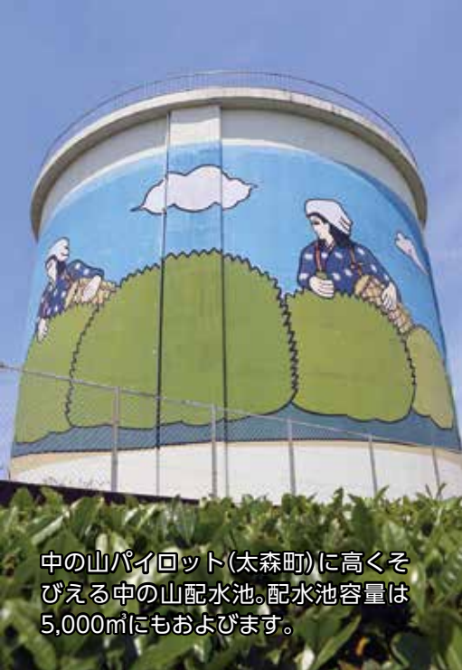
中の山パイロット(太森町)に高くそびえる中の山配水池。配水池容量は5,000㎡にもおよびます。