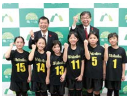
※6人とも「関スボ少グリーンキッズ」所属

「第4回全日本女子総合選手権」女子ドッジボール大会に、県代表チーム「心華」のメンバーとして出場の小学生たちが市役所を訪問(11月27日)。大会への意気込みを語っていただくとともに、今後のさらなる活躍をみんなで誓いました。