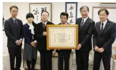
文部科学大臣賞受賞 川崎小学校学校運営協議会

亀山の地で自然の味を大切にしながら丹精込めて作り上げたお茶(煎茶)が、味・香り・品質などで優秀であると認められました。